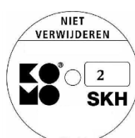
geschikt voor weerstandsklasse 2